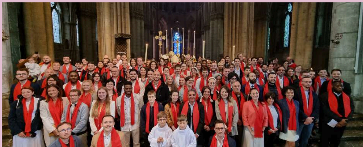
Confirmations des adultes - Dimanche de Pentecôte 2024

* selon le rituel de l'Initiation chrétienne des Adultes