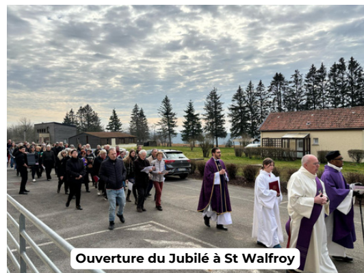
Ouverture du Jubilé à St Walfroy