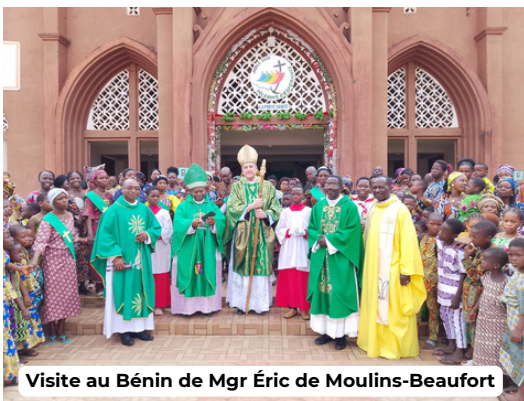
Visite au Bénin de Mgr Éric de Moulins-Beaufort