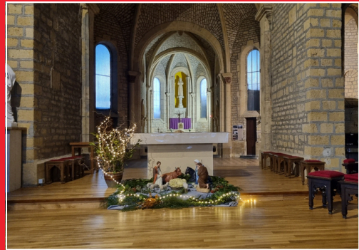
Réaménagement du chœur de l'église de l'ermitage St Walfroy et rénovation de l'autel : la commission a choisi un des projets présentés.