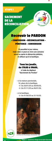
A la basilique Notre-Dame d'Espérance, à Charleville, un parcours en 7 étapes.