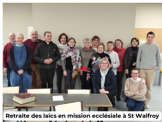
Retraite des laïcs en mission ecclésiale à St Walfroy