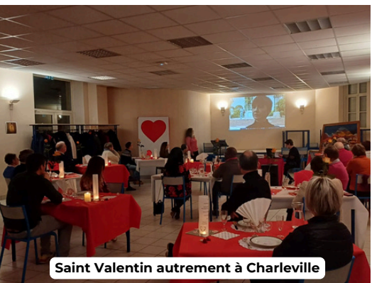
Saint Valentin autrement à Charleville