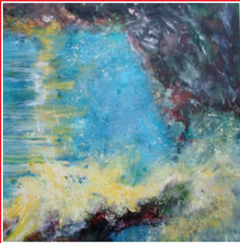
Tableau Résurrection, Rethel, installé fin avril 2025

Pour les vitraux, il a des créations régulières. On peut dans la Marne citer les nouveaux vitraux dans l'église de Bourgogne et celui qui sera bientôt installé à Jonquery, dans le sud de la montagne de Reims ; et, dans les Ardennes, ceux réalisés pour l'église de Givet, création majeure des ateliers Simon Marq, où 7 vitraux sur 12 sont déjà installés.