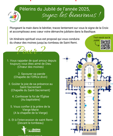
A la basilique Saint Remi à Reims, un parcours avec des extraits de la Bulle du Pape François et des méditations.