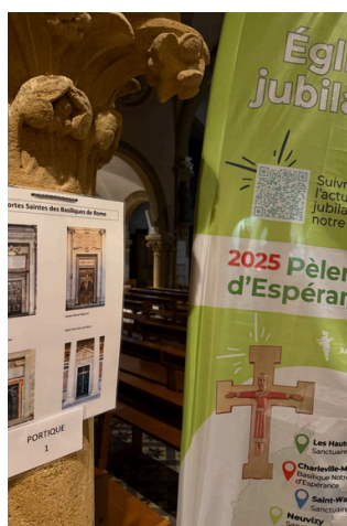
Un parcours dans l'église Saint-Antoine des Hauts-Buttés

En cette année jubilaire, venez découvrir les églises jubilaires du diocèse proposant un parcours pour les pèlerins