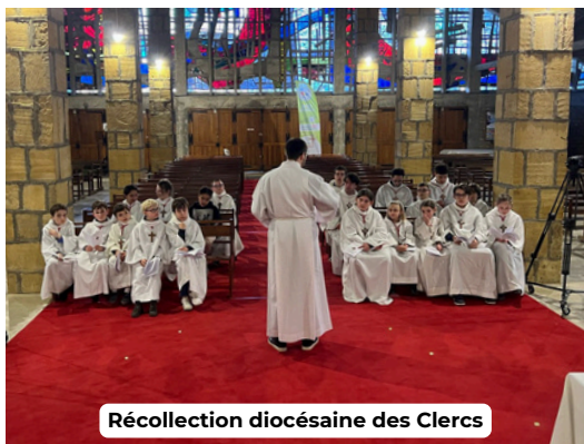
Récollecion diocésaine des Clercs