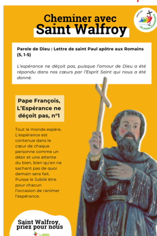
A St Walfroy, cheminez avec les Saints.