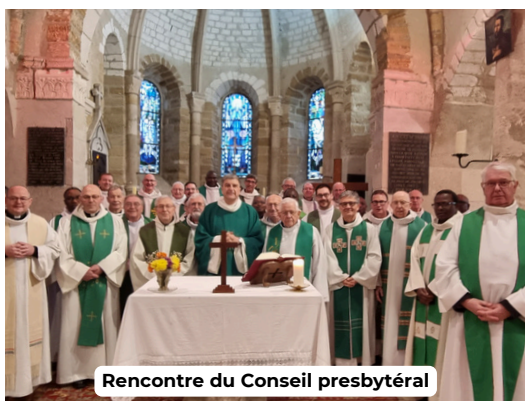
Rencontre du Conseil presbytéral