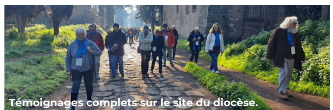
Témoignages complets sur le site du diocèse.

Voilà quelques points forts que je retiendrai de ce magnifique pèlerinage à Rome pour le jubilé des diacres.