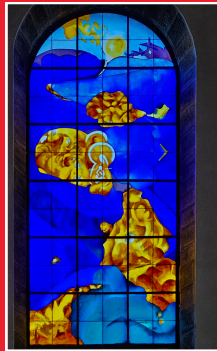
Vitrail de Givet, l'Annonciation